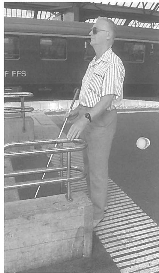
Ein Aufmerksamkeitsfeld über die ganze Breite des Perron zeigt den Treppenabgang an

lauf eines Weges kennzeichnen, die Gehrichtung anzeigen oder als Raster raumstrukturierend wirken. Mit einer Breite von 57 cm dient sie gleichzeitig als Auffanglinie zum Auffinden des Systems. Das Aufmerksamkeitsfeld ist eine Fläche von 3 cm breiten, parallelen Streifen zur Warnung vor Gefahr, als Hinweis auf Abzweigungen, Treppen, etc. und als Einstiegsmarkierung an Haltestellen. Aufmerksamkeitsfelder haben eine Länge von 90 cm (2 Schrittlängen). Ihre Breite ist abhängig von ihrer Funktion und der baulichen Situation (z.B. ganze Perronbreite, ganze Trottoirbreite, ganze Treppenbreite, ...).