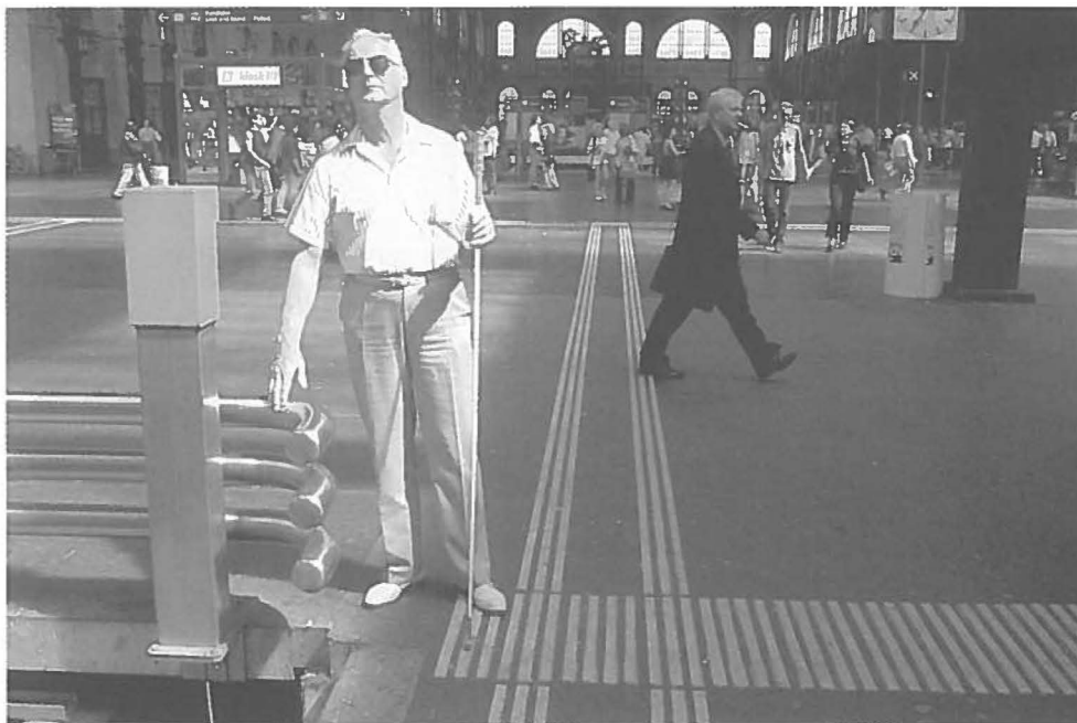
Ein Aufmerksamkeitsfeld markiert den Übergang zwischen Querhalle und Perron und zeigt gleichzeitig die Position der taktilen Gleisnummern an