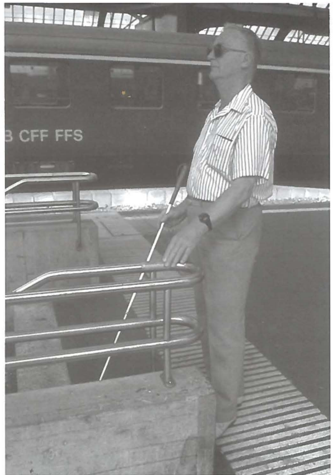
Blinde Person beim Ertasten der Reliefbeschriftung

Damit der Handlauf seine Funktion optimal erfüllen kann, muss er aber einige grundlegende Anforderungen erfüllen. Er sollte 0,85 m bis 0,90 m ab Boden bzw. Stufenvorderkante montiert werden, den Treppenlauf an beiden Enden um mindestens 0,30 m überragen und bei Änderungen der Laufrichtung ununterbrochen weitergeführt werden. Handläufe müssen gut umfassbar sein. Ergonomisch optimal sind runde oder ovale Formen. Für den Durchmesser gilt ein Richtwert von 45 mm. Die Befestigung muss von unten erfolgen und darf das Gleiten mit der Hand nicht beeinträchtigen. Der lichte Wandabstand muss mindestens 50 mm betragen. Ideal sind Handläufe aus handwarmen Materialien (z.B. Holz). Wird daneben noch beachtet, dass sich der Handlauf kontrastreich von der Wand abhebt, ist die Treppe (oder Rampe) mit einer einfachen und kostengünstigen Massnahme für alle Benutzer optimiert. Die Anforderungen an Handläufe ergeben sich aus den Bedürfnissen unterschiedlicher Nutzergruppen.