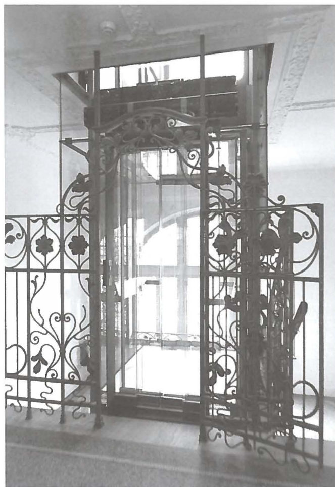
Ascenseur moderne dans l'hôtel historique «Waldhaus Flims Mountain Resort & Spa»

Contrairement aux mesures économiquement acceptables, l'importance respective entre la protection d'un bâtiment et des mesures préjudiciables aux personnes ne peut être fixée avec précision. Lors de l'évaluation, d'une part, de la protection des monuments historiques et, d'autre part, du droit garanti par la loi de l'accès aux bâtiments et aux installations, on procèdera pour chaque cas, concrètement, à une analyse dans le cadre des lois, des normes et de la proportionnalité. Selon l'article 11 de la LHand, est autorisé le recours à une évaluation entre le droit à l'accessibilité et d'éventuels intérêts contraires tels que rationalité des dépenses, sûreté de l'exploitation et protection du patrimoine. C'est ainsi que dans le Commentaire relatif à l'Ordonnance (OHand), il est prescrit à propos de la pondération des intérêts entre l'objet devant être protégé et l'interdiction de la discrimination: